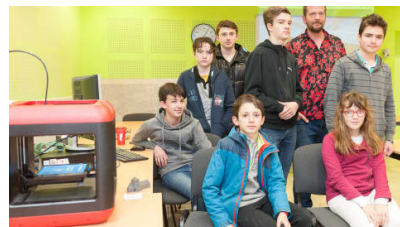
Des jeux vidéos à l'impression 3D