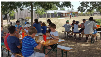
Des séjours sous le signe du partage