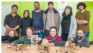
Le numérique au service de la pédagogie