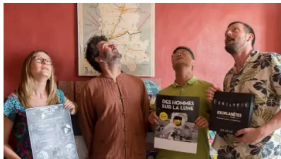
Le ciel vu de la terre : le Space Bus fait étape à Melle