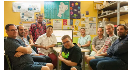
Réparer au lieu de jeter